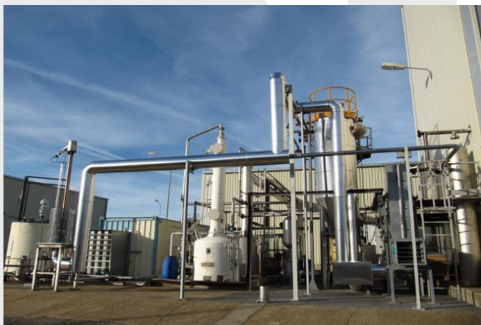
Planta de tratamiento gases