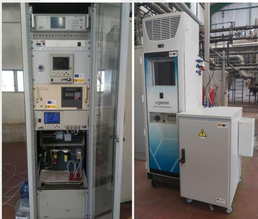
Analizadores de gases