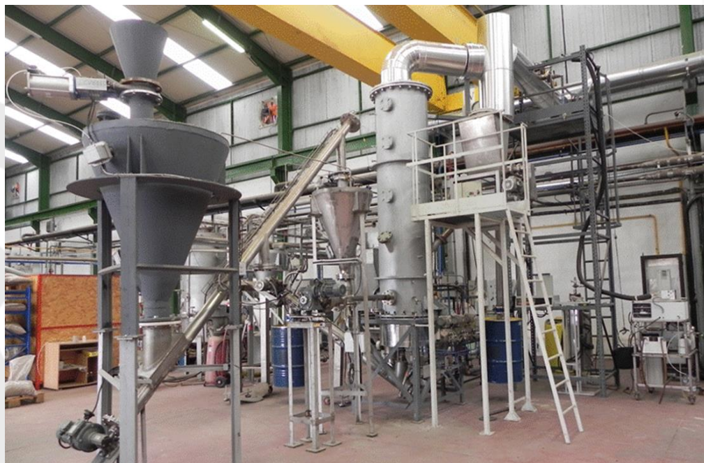
Lecho fluidizado burbujeante 150 kW t