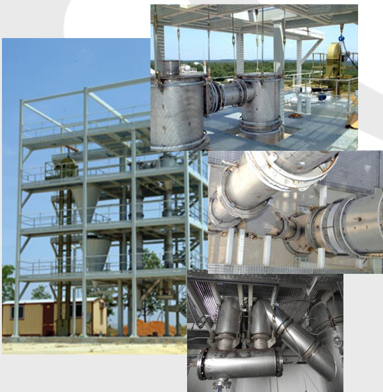
Lecho fluidizado circulante 500 kW t