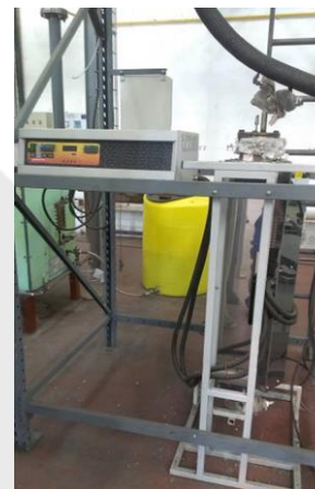
Equipo de craqueo